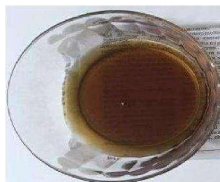
Preparazione NON ADEGUATA

Un semplice metodo per essere certi dell'efficacia della preparazione assunta è verificare che le ultime evacuazioni siano liquide e di colore chiaro.